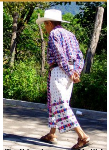
Traditionele mannenkledij ^ en vracht die via een hoofdband gedragen wordt.