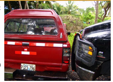
Een sta-in-de-weg, maar geen partij voor de Dodge.

mels voortdurend de Bomberos. Hoewel ze claimen vaak de knippers nodig te hebben bij ongelukken hoeven ze gelukkig in de 2 dagen dat we er te gast zijn slechts 2x met de rode wagen uit te rukken. 1x omdat er een man van een rots is gevallen, 1x vanwege een gasfles ontploffing in een keuken. 3x gaat de kleine Japanner weg, 1x voor boodschappen, 1x voor iets kleins dat bij aankomst al opgelost blijkt te zijn en 1x met een collega die op het terrein aan zijn auto werkt en oogletsel oploopt door een ontploffende accu! De Japanner wordt ook gebruikt om gewonde te vervoeren (de echte ambulance is kapot en geen geld voor onderdelen) waarbij de patiënt met de benen buiten boord bij het ziekenhuis wordt afgeleverd.