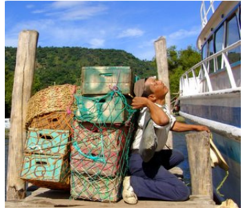
Verplichte parking Privado Mexicaans-Guatamaalse grens