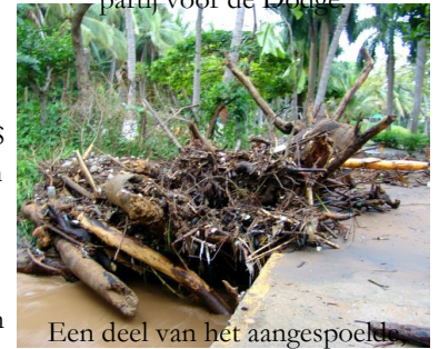
Een deel van het aangespoelde waterweg versperrende, wakhout en boomstronken.

OF JE DE TAAL SPREEKT IS NIET VAN BELANG ALS ZE JE MAAR BEGRIJPEN